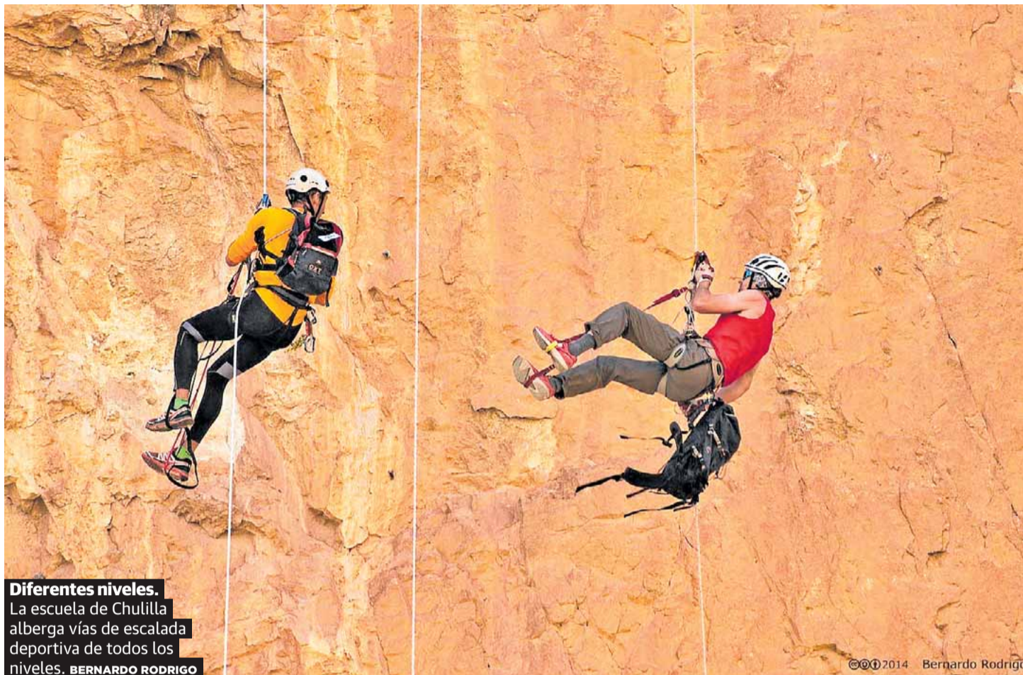
Diferentes niveles. La escuela de Chulilla alberga vías de escalada deportiva de todos los niveles. BERNARDO RODRIGO